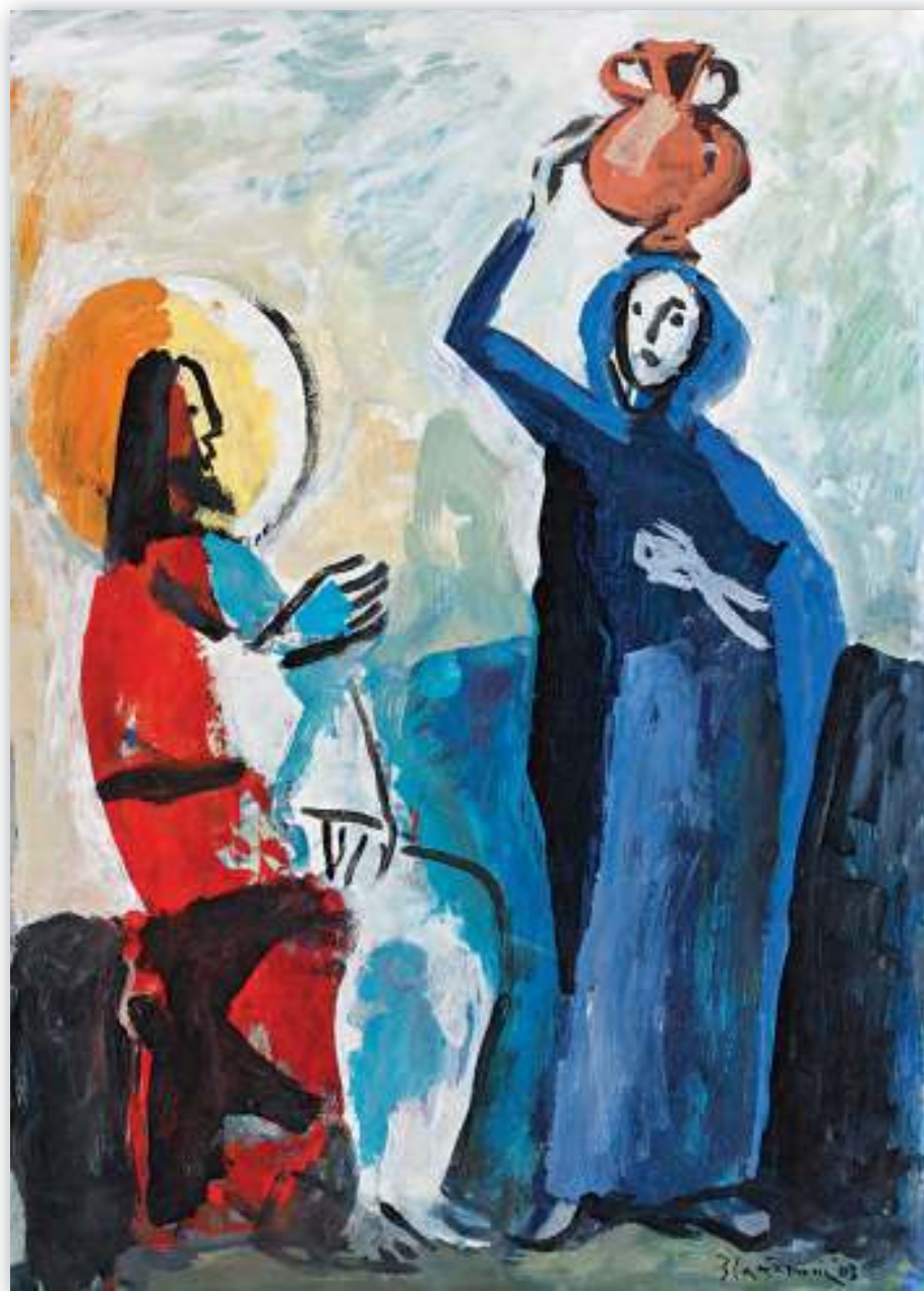
Isus i Samaritanka