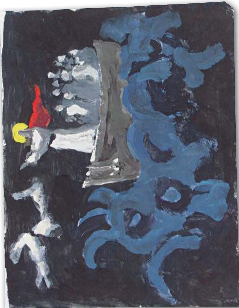
Isus utišava oluju