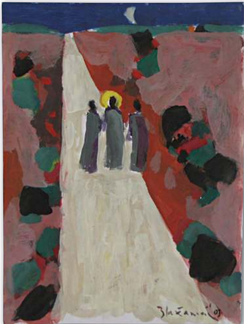
Put u Emaus