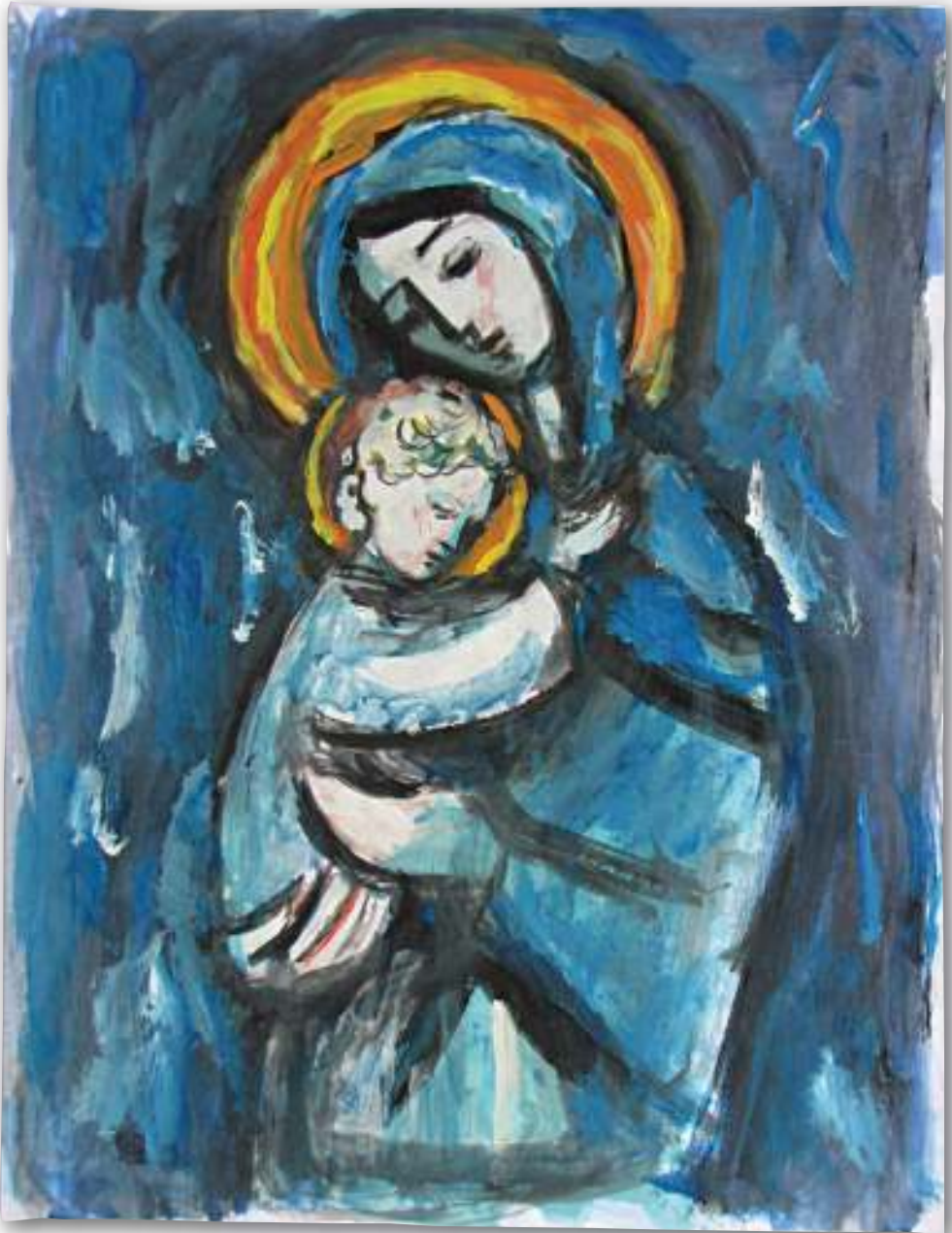
Gospa s Isusom