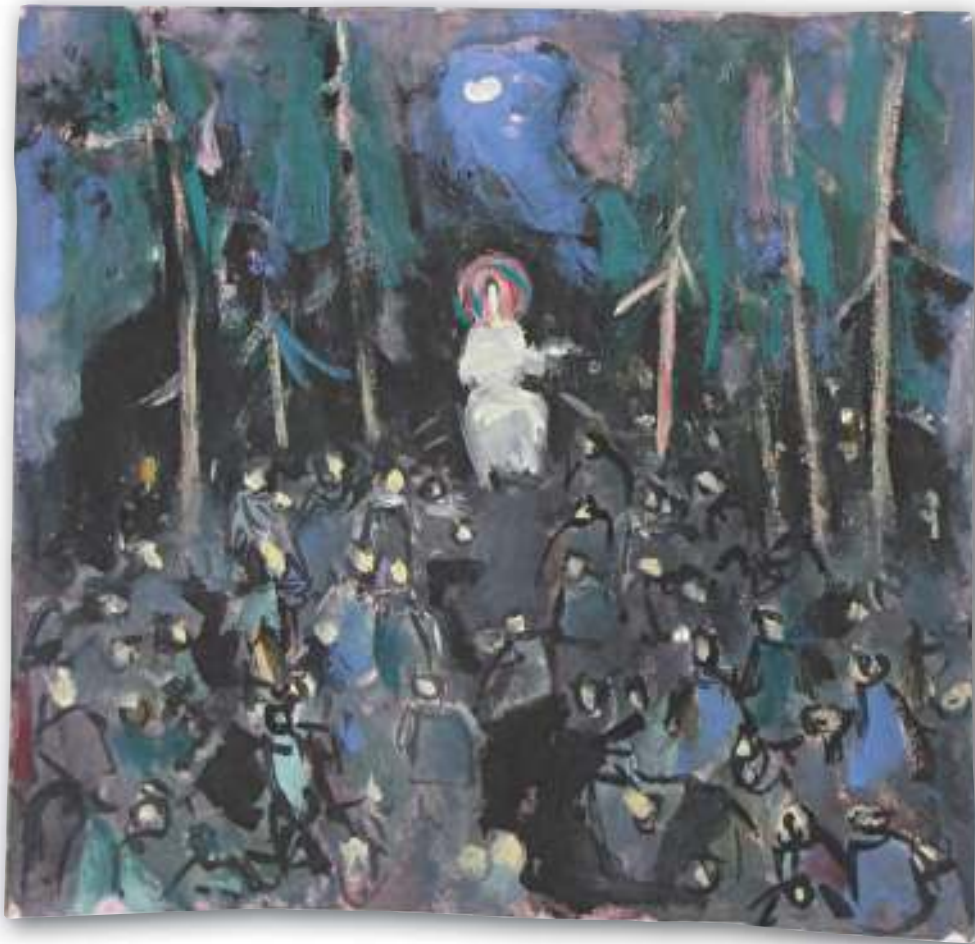
Propovijed na gori