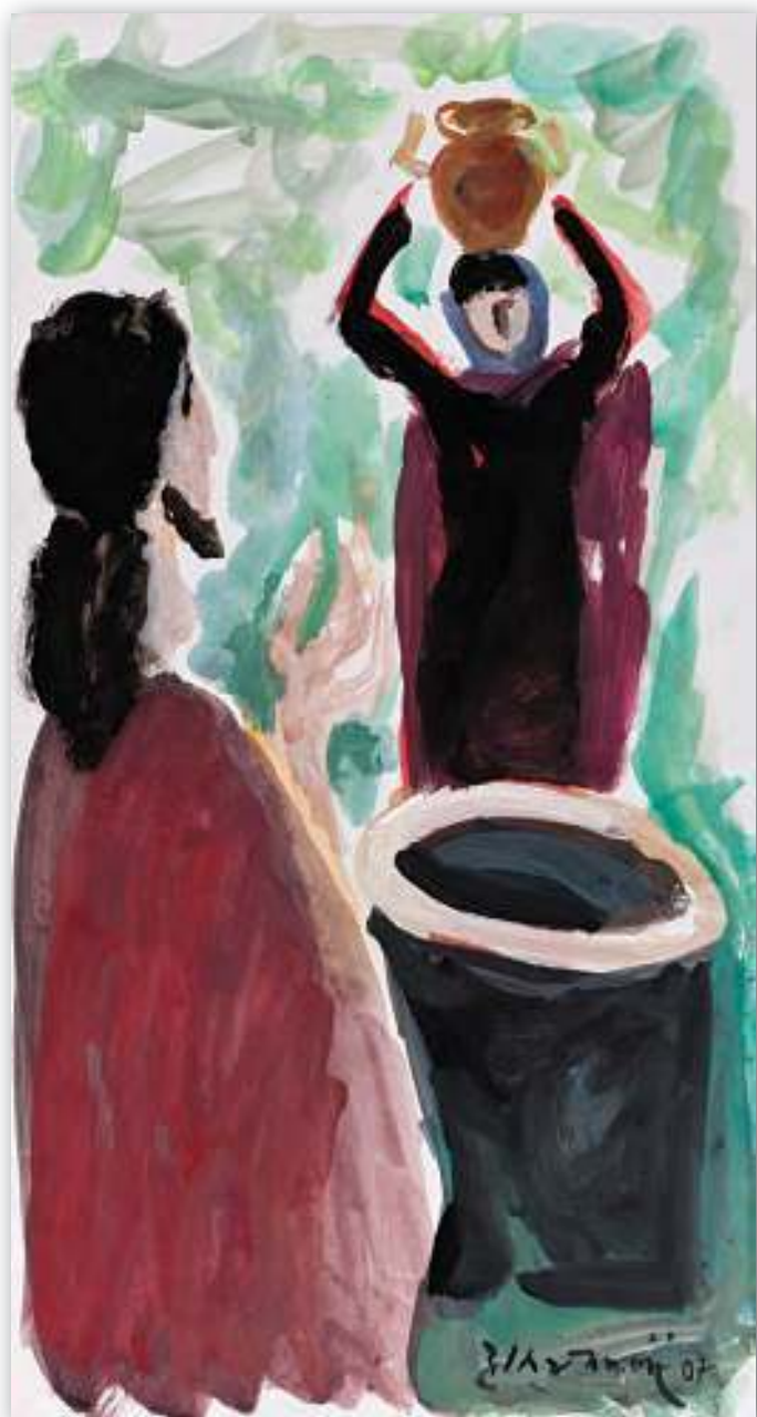
Na Jakovljevu zdencu