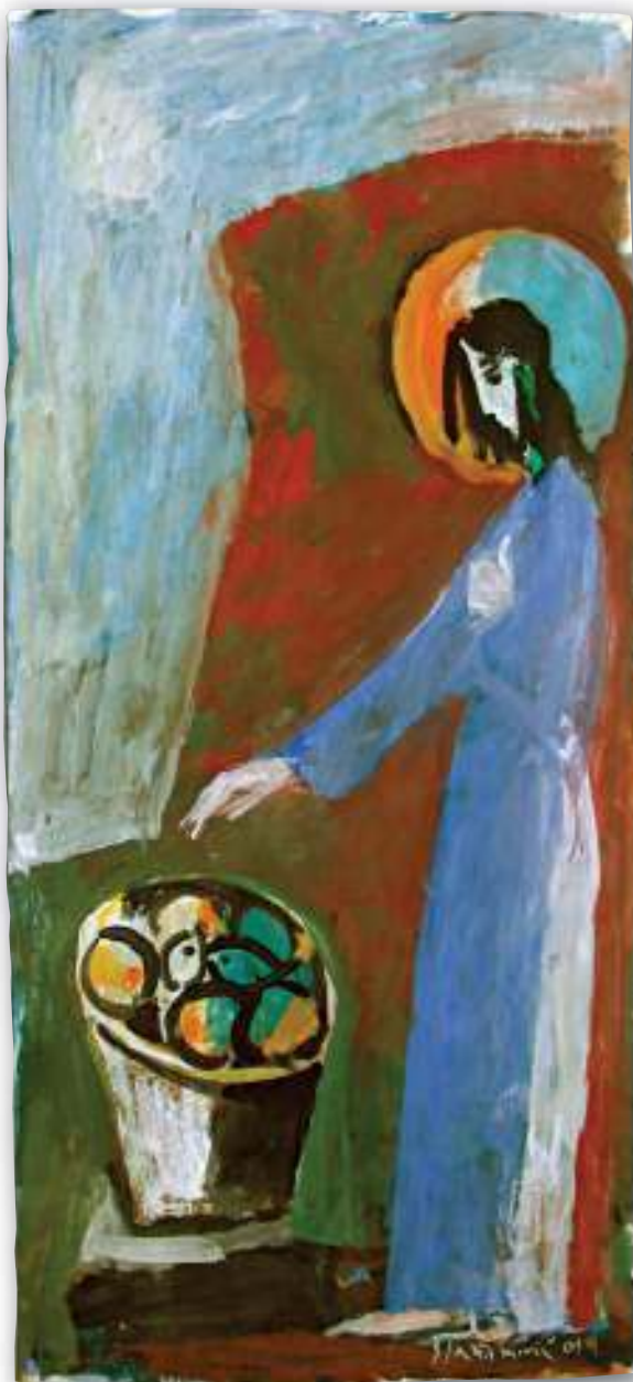
Isus blagoslivlja kruhove i ribe