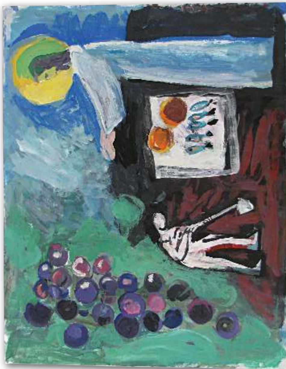
Čudo umnažanja kruha